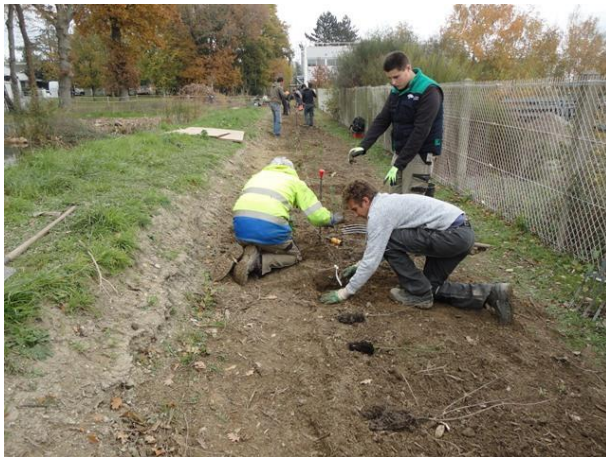
Plantation d'une Haie bocagère Chantier partenaire 2017/2018